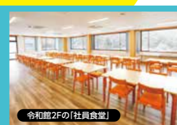
令和館2Fの「社員食堂」