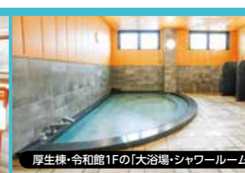
厚生棟・令和館1Fの「大浴場・シャワールーム」